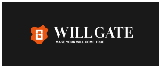
背景色が黒色の場合