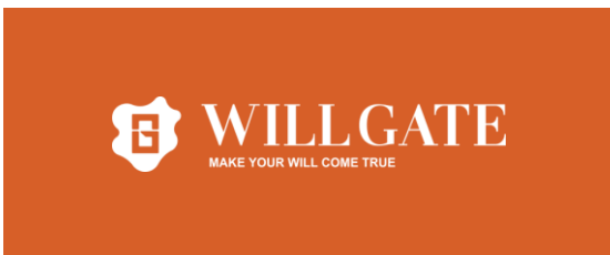
背景色がオレンジ色の場合

FAX、またはロゴの指定色が背景になった場合は下記の単色表現のものを使用してください。