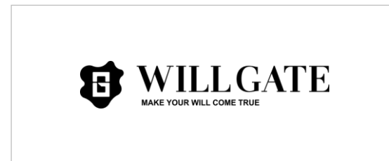
※ FAX、またはモノクロ印刷の場合